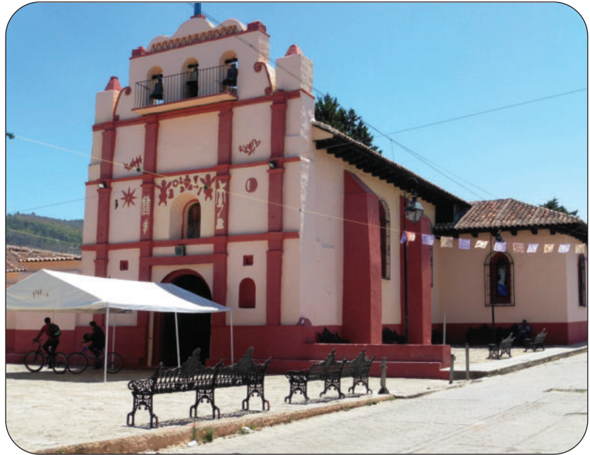
Eglise typique située dans un quartier de San Cristobal de las Casas

Une autre tradition, moins connue en Europe mais très populaire dans toute l'Amérique Latine, est « la visite des sept maisons » ou « le parcours des sept stations », qui a lieu le Jeudi