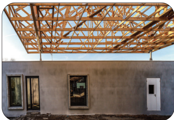
Avancement des travaux de la nouvelle friperie

Comme vous le voyez, nous avons vraiment besoin de vous pour toutes ces actions. Merci d'avance !