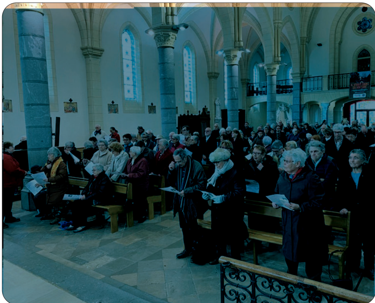
L'assemblée en l'église de Léon

Toi, sans Te lasser, Tu m'appelles à la Vie, Tu me dis que je suis lumière. Tu m'invites à faire jaillir la lumière par mes mains, mes regards de tendresse, et mes actes solidaires. Permetts que mon chemin de nuit s'éclaire, et que pour d'autres, je sois Lumière.