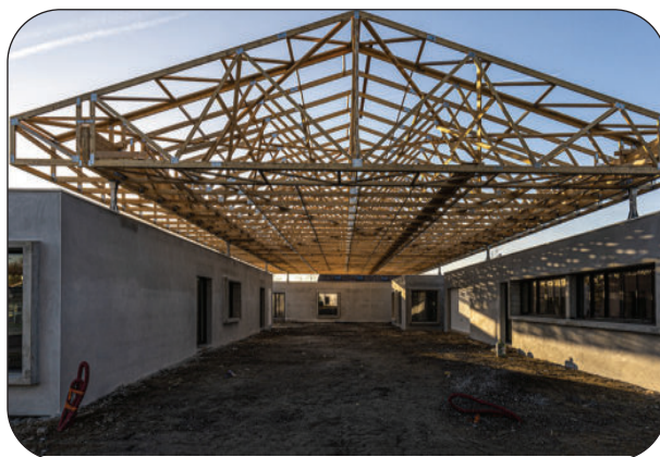
Avancement des travaux de la halle du partage